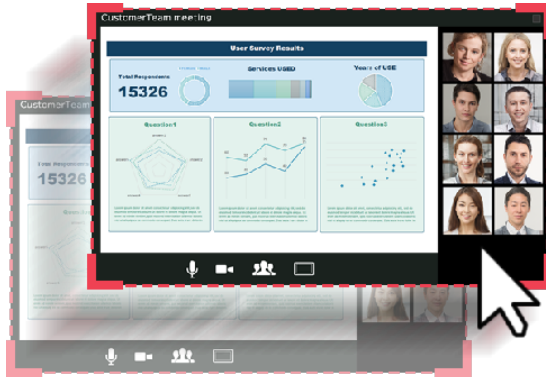
アプリ画面を移動しても追従して録画