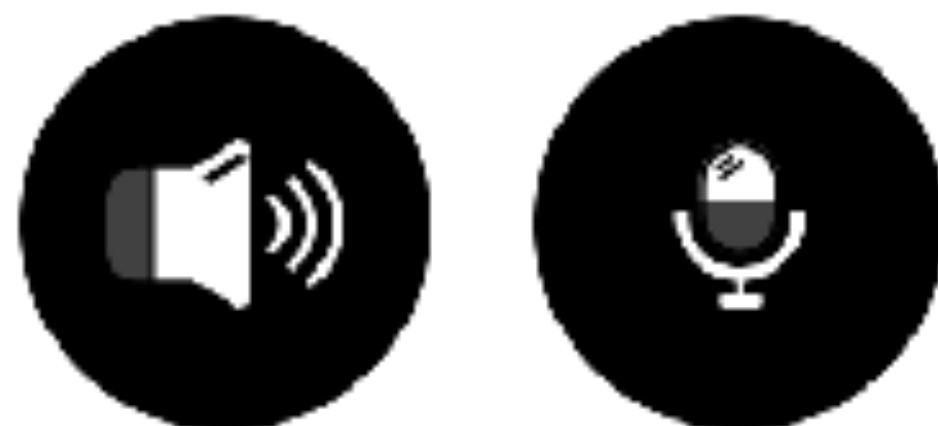
システムサウンドとマイクを同時録音